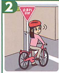
2 交差点では信号と一時停止を守って、安全確認