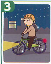
3 夜間はライトを点灯