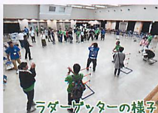
ラダーゲッターの様子