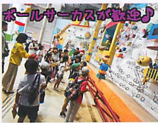
ボールサーカスが歓迎♪