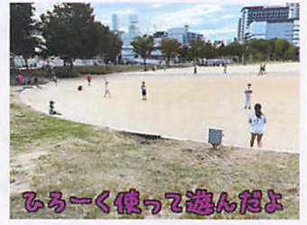
ひろく使って遊んだよ