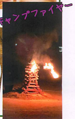
キャンプファイヤー