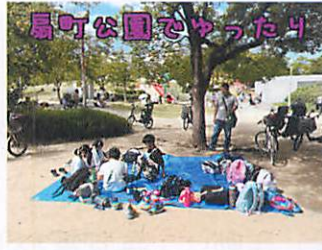
扇町公園でゆったり