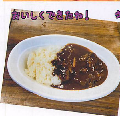
おいしくできたわ!