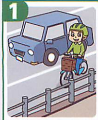
1 車道が原則、左側を通行 歩道は例外、歩行者を優先