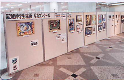
中央図書館の作品展示