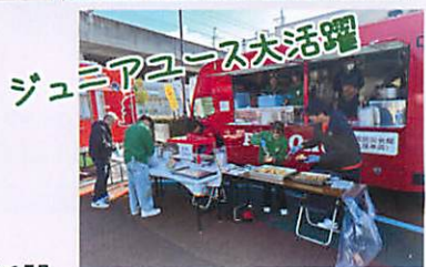
ジュニアユース大活躍

青指タイムスに関するご意見・ご感想は各校下青少年指導員のかたにご連絡ください。また、青少年健全育成に関する情報も願います。