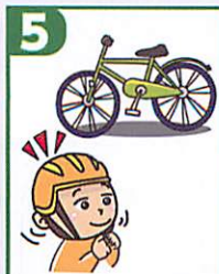
5 ヘルメットを着用