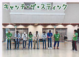
キャッチザスティック