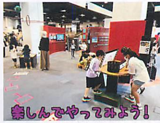
楽しんでやってみよう!