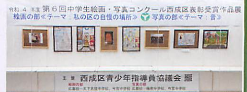
昨年度の作品展示