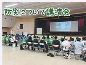
防災について講演会