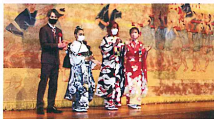
令和3年度午前の部