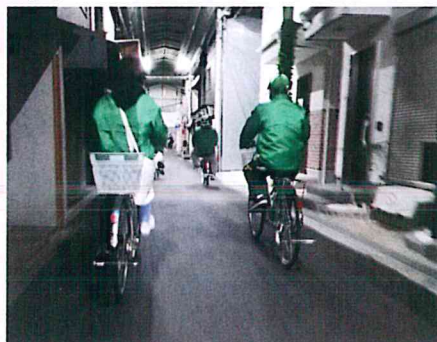
夜の商店街なども重点的に巡視を行っています