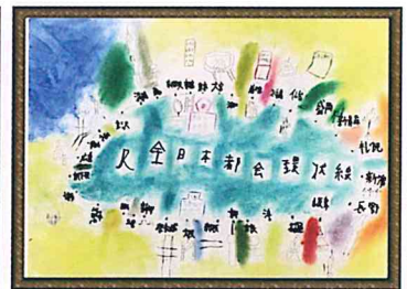
区青指文化部長賞