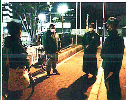
区民センターから各地域に巡視に出かけます