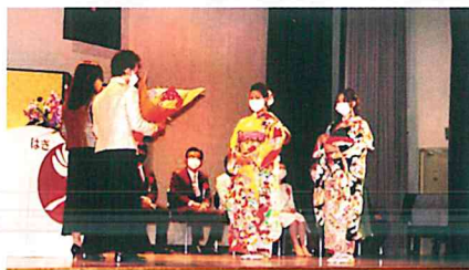
令和2年度午前の部

例年の記念写真撮影会やビンゴ大会も行えない式典でしたが、私たち青少年指導員は受付、場内外整理などを行い、新成人の門出に花を添えることが出来ました。