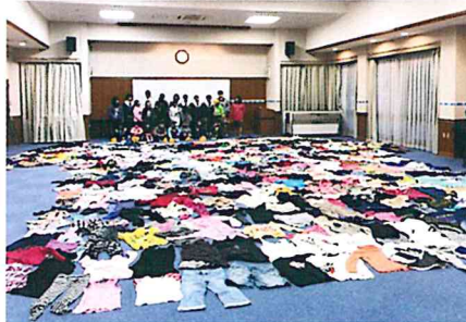
服のチカラプロジェクト

新型コロナウイルス感染症での学校対応により、一学期実施する行事が二学期に延期され、二学期は行事が連続する厳しい日程でありましたが、体育大会、文化祭、修学旅行、一泊移住、職場体験と年度当初に予定していた全ての行事を実施することができました。大変な中でも、全ての行事ができたのは、生徒が一生懸命に笑顔で取り組んでいたからです。これからも生徒が笑顔で頑張れる場所を作っていきます。