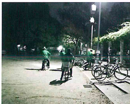
夜の公園やコンビニ前などの集まりやすい場所を重点に