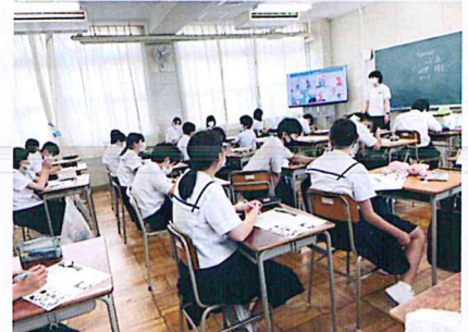
パラリンピックについて学習する2年生