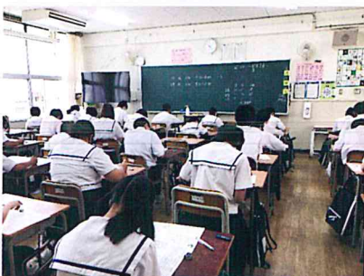
初めてのテストを受ける1年生

部活動では、新入部員が入部し、これから活動が盛り上がっていくところでの活動休止。生徒たちにとってもどかしい日々が続いていましたが、6月に入り、段階的に活動ができるようになりました。放課後、グラウンドや体育館では、元気に活動する生徒たちの姿が見られます。今年は部活動の入部率が高く（3年生64%、2年生73%、1年生93%）、成南中学校の部活動がますます盛り上がっていくことを期待しています。