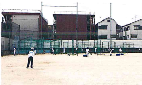
久しぶりの部活動に励む生徒たち