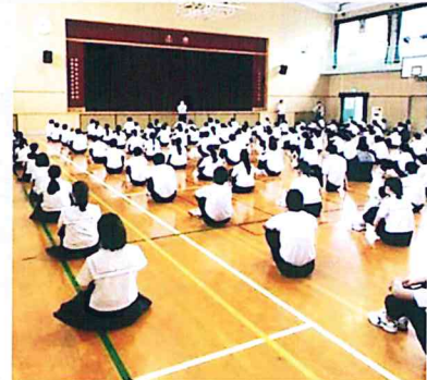
体育館でも間隔を確保