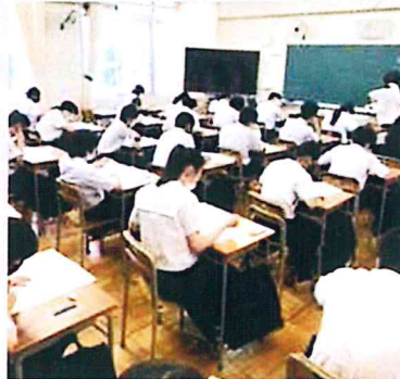
マスク着用での授業風景