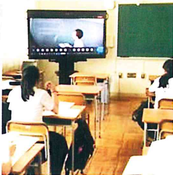
オンライン利用の授業

今後も厳しい状況は続くと考えられますが、生徒たちにはこの経験を生かし、きちんとした社会をつくれるように成長してほしいと願っています。