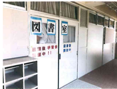
新しく出来た図書室