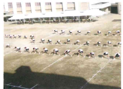
広くなったグラウンド