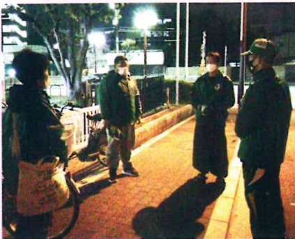
区民センターから各地域に 巡視に出かけます