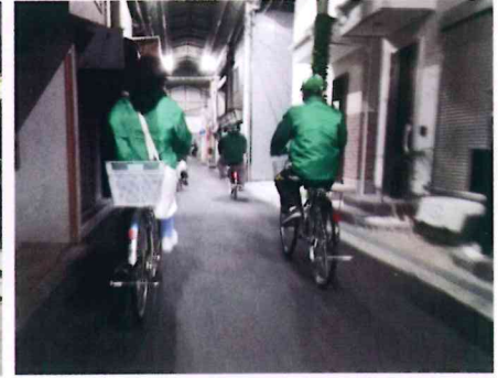
夜の商店街なども重点的に 巡視を行っています