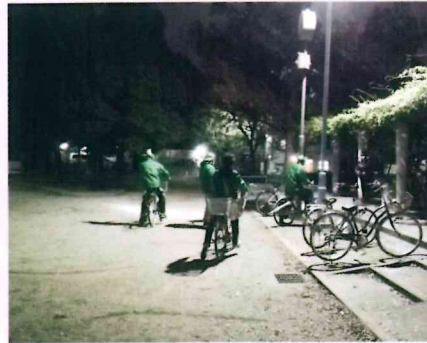
夜の公園やコンビニ前などの 集まりやすい場所を重点に